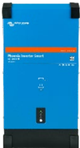
Střídač Phoenix Smart 12/3000