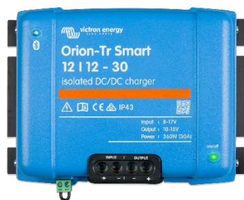
Orion-Tr Smart 12/12-30