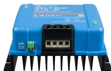
Orion-Tr Smart 12/12-30